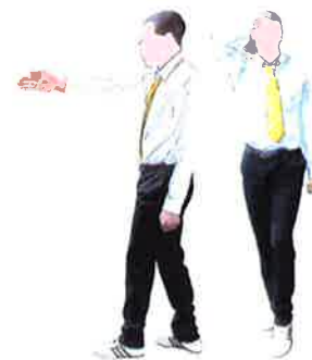
Reprendre le combat kyessok