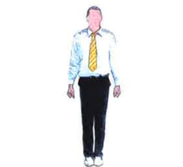
Au centre de l'aire de combat