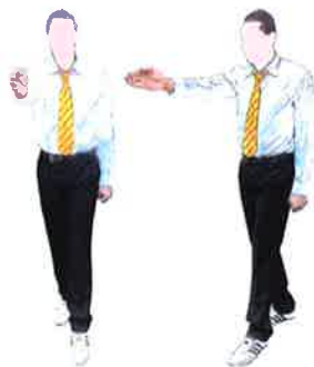
Keman (fin du combat)