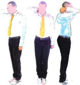
Armement du geste