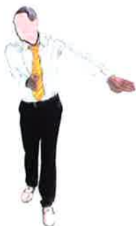
Protéger le combattant en danger