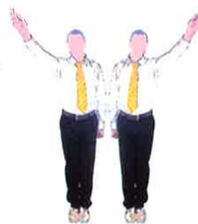
Décision (Tchong Song/Hong Song)