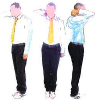
Armement du geste