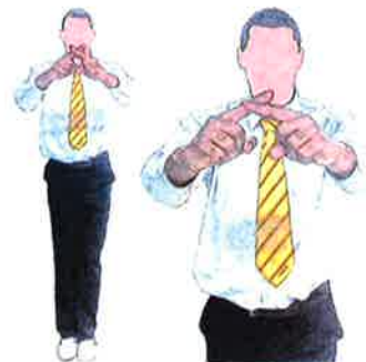
Geste d'arrêt ponctuel du combat (Shigan)