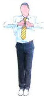
Points face à face