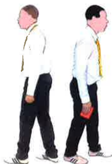
Se diriger vers le coach demandeur