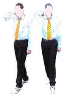
Armement du kalyeo