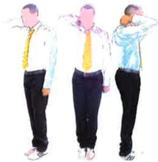
Armement du geste