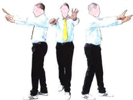
Montrer au coach le nombre 6 déjà atteint