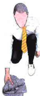
Ramasser la serviette