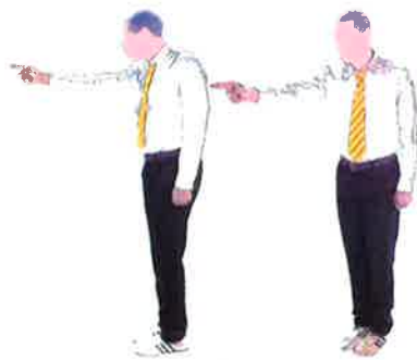
Montrer le (coach / publique) du combattant concerné