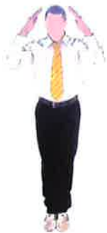
Inviter les combattants à mettre leurs casques