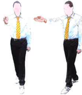
Geste de séparation : Kalyeo