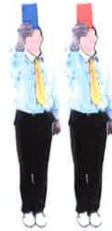
Montrer la carte du coach demandeur en disant Tchong / Hong Vidéo Replay