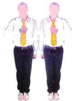
Armement du geste coté vainqueur