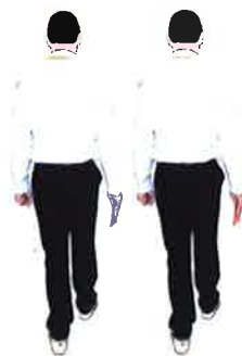
Retourner au centre de l'aire de combat avec la carte du demandeur