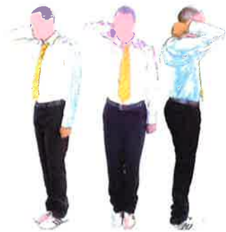
Armement du geste