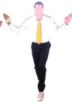
Armement du geste de début de combat