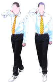
Armement du keman