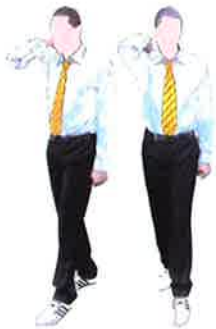
Armement du Keman