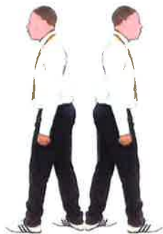
Se diriger vers le coach demandeur