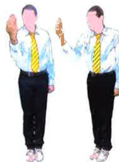
Plier la main droite à 45° en disant docteur, docteur