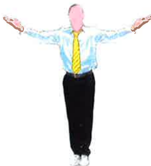
Ecarter les bras