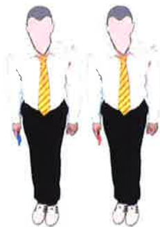
Expliquer la demande au Vidéo Replay