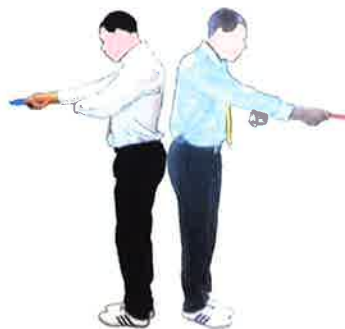
Remettre la fiche au coach demandeur