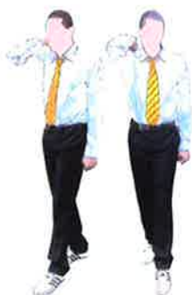
Armement du Kalyeo