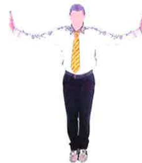
Ecarter les bras (signe de séparation)