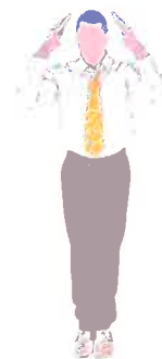
Inviter les combattants à enlever leurs casques (le tenir sous le bras gauche)