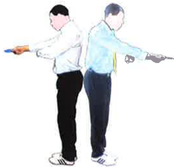
Ecouter la réclamation et Récupérer la fiche du coach demandeur