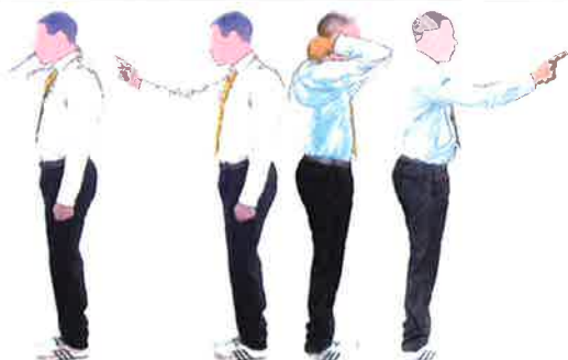
Montrer le combattant concerné