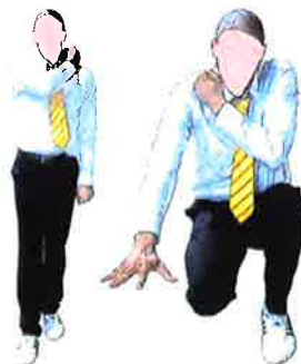
Armement pour le décompte