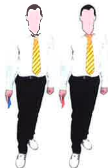
Se diriger vers la table centrale