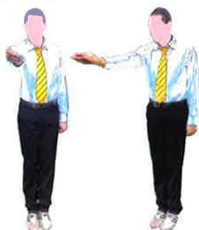
Tendre la main droite