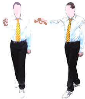
Keman (Fin du combat)