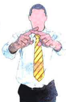
Ramener les combattants au centre en disant Tchong Hong