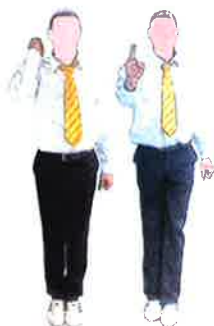
Geste d'arrêt du combat 1 minute (Kye shi)