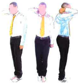
Armement du geste