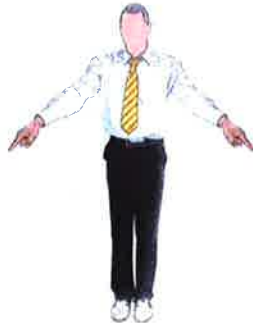
Appel des combattants : Tchong - Hong (indication des emplacements)