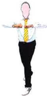
Ramener les points face-à-face