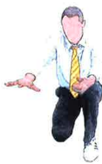
Décompte pour combattant au sol (Knock down)