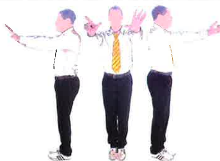
Montrer au coach le nombre 7 déjà atteint