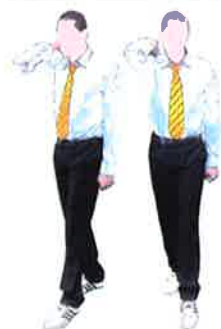
Armement du keman