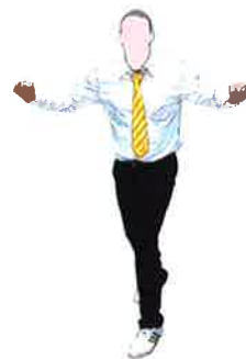
Ecarter les coudes les points fermés