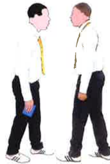
Retourner au centre l'aire de combat