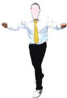
Ecarter les coudes les points fermés