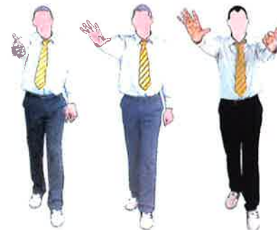
Décompte pour le combattant debout (Standing down)