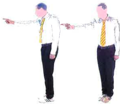
Montrer le (coach / publique) du combattant concerné