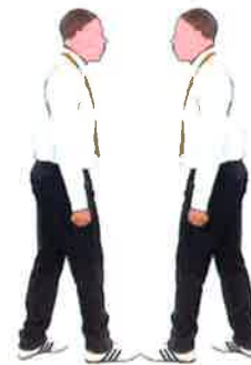
Retourner au centre de l'aire de combat et appliquer la décision