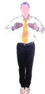
Les faire revenir vers le buste