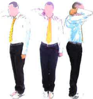
Armement du geste