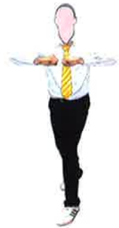
Ramener les points face-à-face